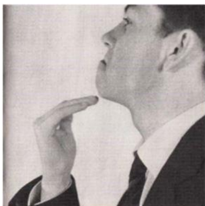
Podrbání se pod bradou – Itálie = „Zmiz odsud!“

Na která gesta si v zahraničí ještě musíme dávat pozor?