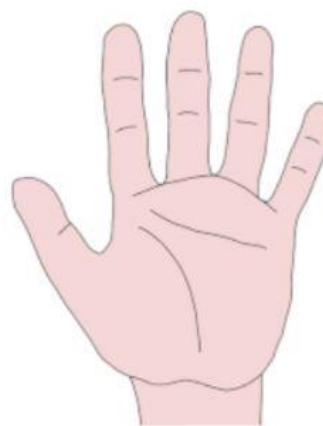
Otevřená dlaň – Řecko = hrubá urážka